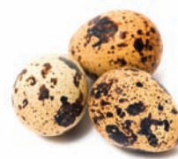
Cœufs de Caille