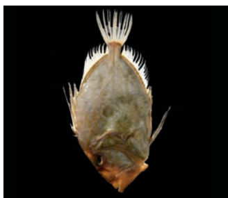
Le Saint Pierre