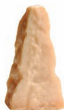
Parmigiano Reggiano AMBROSI