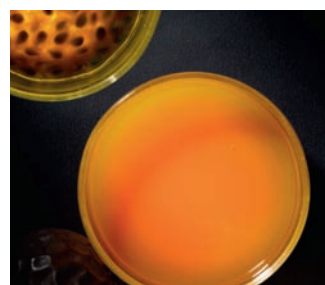
La Pulpe de Passion