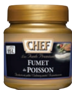
Fumet de Poisson Premium CHEF® en Pâte