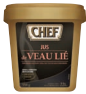
Jus de Veau Lié en Flocons CHEF®