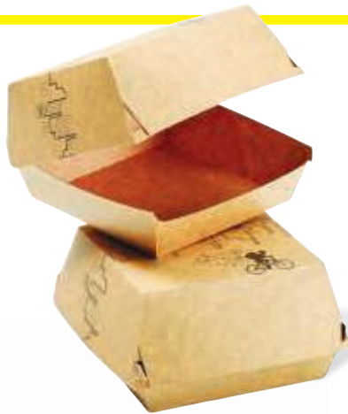
BOÎTE BURGER DELIVERY GAULT ET FREMONT Dim. 117 x 118 x 74 mm Colis de 200 Code : 232606