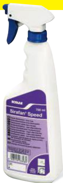
SIRAFAN SPEED ECOLAB Désinfectant de surface rapide prêt à l'emploi sans rinçage. Flacon de 750 ml Colis de 6 Code : 231711